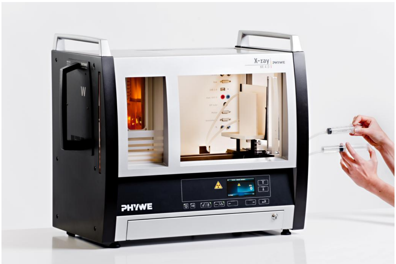
Abb. 1: P2541901

Dieser Versuch ist in dem Erweiterungsset XRI 4.0 X-ray Radiografie enthalten.