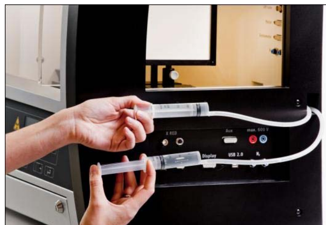
Abb. 4: Durchführung