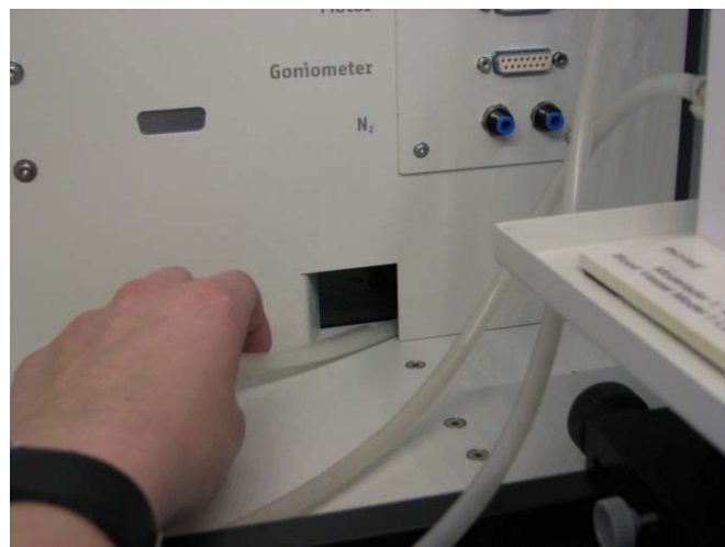
Abb. 3: Schlauchführung