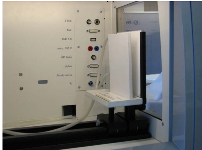
Abb. 2: Aufbau im Experimentierraum

Wenn Sie die Wirkung des Kontrastmittels photographisch dokumentieren möchten, verfahren Sie am besten wie in P2542001 angegeben.